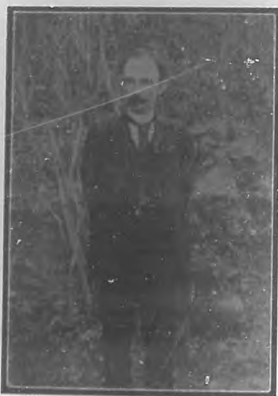
José Martí Fotografía hecha en Jamaica.

José Dolores Poyo Estenoz, ayudados al principio por algunos patriotas dentro de la isla, hasta 1892 en que José Martí se iniciara en aquellos trabajos y fundara el Partido Revolucionario Cubano , agrandando los trabajos; pero reconociendo que todo estaba hecho, por aquel grupo de patriotas, cuyos núcleos se extendían por todo Oriente, las Villas y la Provincia de Matanzas, bajo la dirección de aquella Convención , que la formaban patriotas notables é incorruptibles.