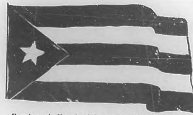
Bandera de Narciso López tremolada en Bayate

Jiguaní , como hemos dicho, distaba tan solo de Baire