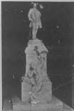
Monumento á Fernández Casariego.