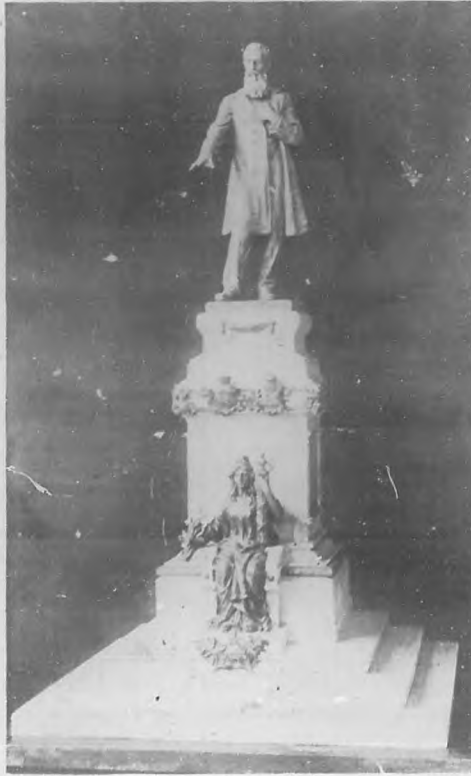
Proyecto premiado original del notable escultor italiano señor Rafael Atché, del Blanco.

Ese proyecto débese al laureado escultor catalán señor Rafael Atché, autor de numerosas obras de arte que son verdaderas joyas del arte escultórico español.