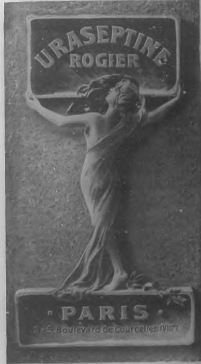
EL MÁS PODEROSO DISOLVENTE AL ACIDO URICO

En la próspera ciudad de Cárdenas ha tenido efecto el