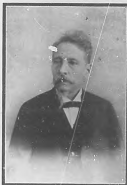
General Bartolomé Masó